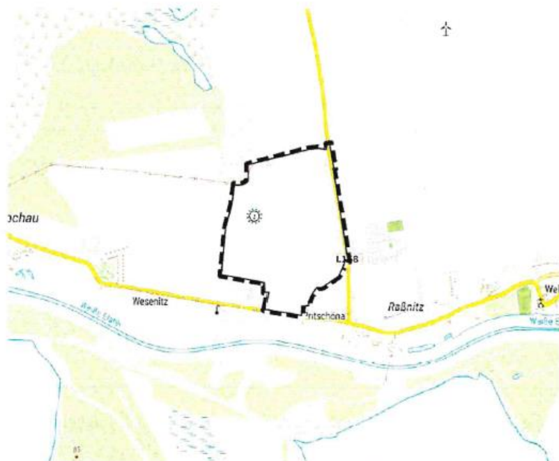
Übersichtskarte mit Kennzeichnung Grenze des räumlichen Geltungsbereichs des Bebauungsplans

Übersichtsplan des Geltungsbereiches für den in Aufstellung befindlichen B-Plan Nr. 9/27 „Gewerbe- und Industriegebiet Lochau- Raßnitz“: